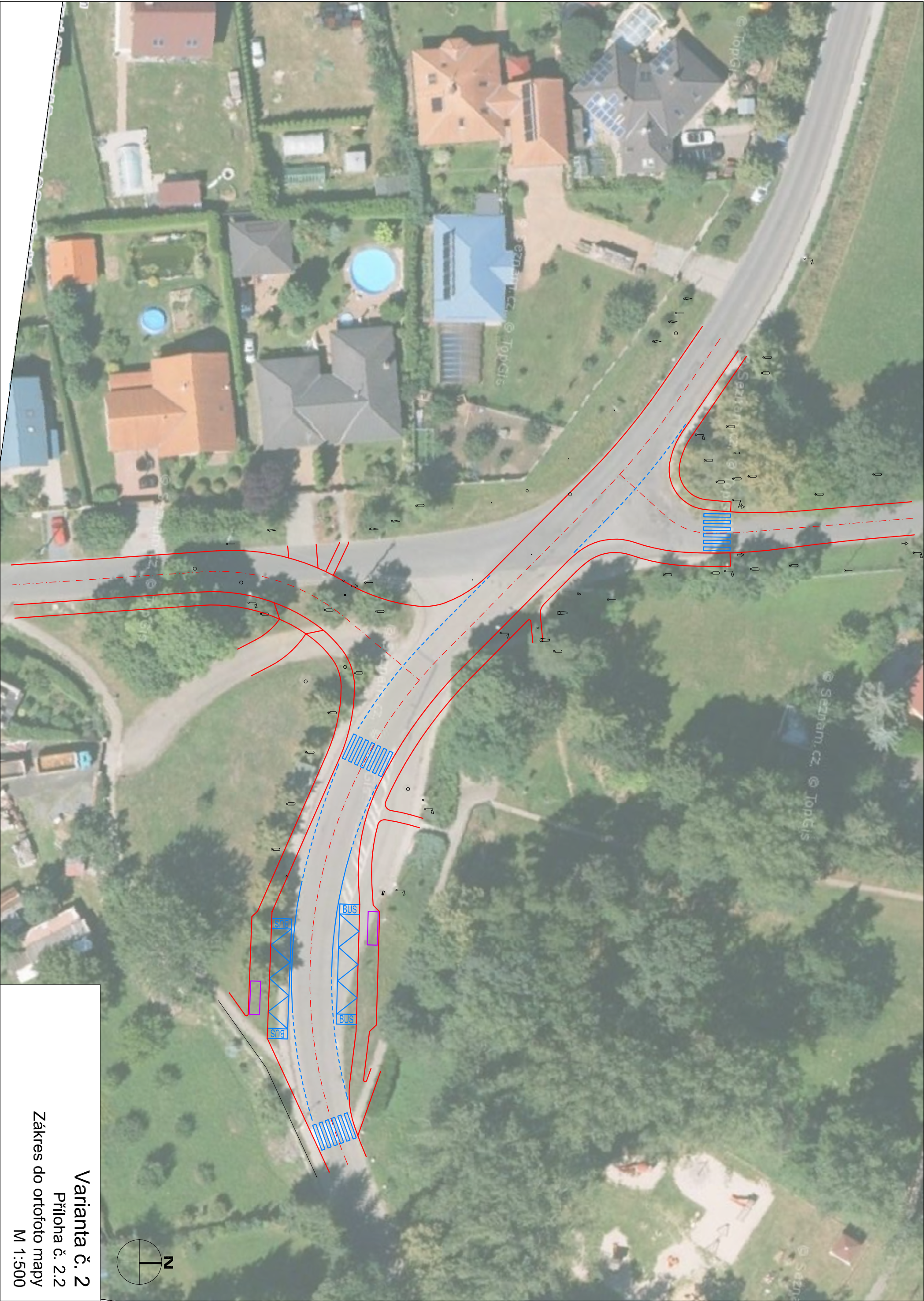
Varianta č. 2 Příloha č. 2.2 Zákres do ortofoto mapy M 1:500